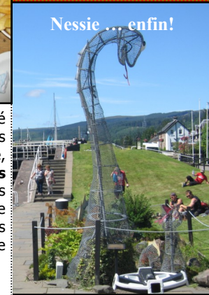
Nessie ... enfin!