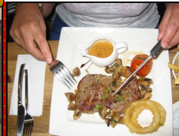
Comme annoncé on s'est régalé en Écosse, cuisine de produits frais locaux, inventive et savoureuse, tels ces plats: steak d'angus (bœuf local) accompagné de fruits de mer et de sauces et aussi le fameux haggis (panse de brebis farci!) sans oublier les poissons, le mouton ou la volaille.