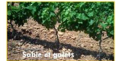
Sable et galets