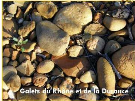
Galets du Rhône et de la Durance

Située entre Cévennes et Camargue, l'appellation « Costières-de-Nîmes » est en AOC depuis 1986 en Costières du Gard et AOC Costières-de-Nîmes depuis 1989. Sur les 25000ha seulement 4500 servent à la viticulture comprenant 24 communes.