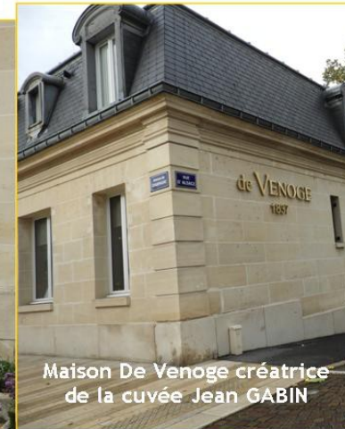
Maison De Venoge créatrice de la cuvée Jean GABIN