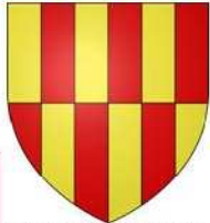
Armoiries de Buzet s/ Baïse