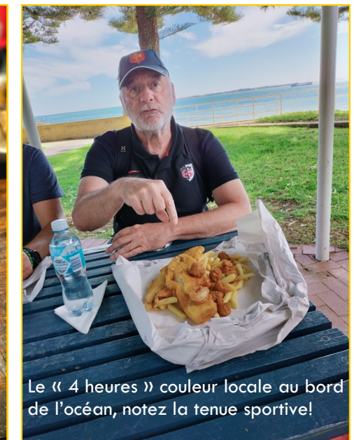
Le « 4 heures » couleur locale au bord de l'océan, notez la tenue sportive!